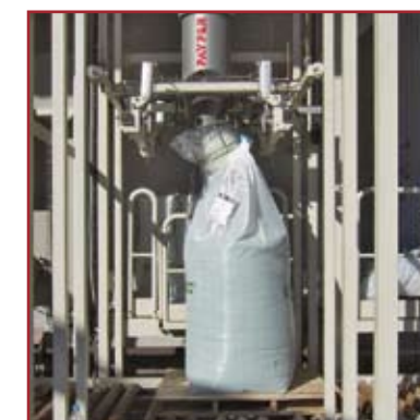
Estación de llenado de big-bags 1 asa Big-bag filling station 1 handle