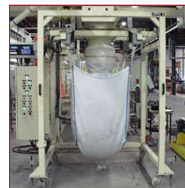
Big-bag 4 asas con ruedas desplazamiento Big-bag 4 handles with wheels for movement