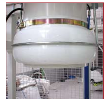
Boca hinchable para sujeción. Máxima estanqueidad al polvo Inflatable filling spout for hanging. Optimum dust tightness