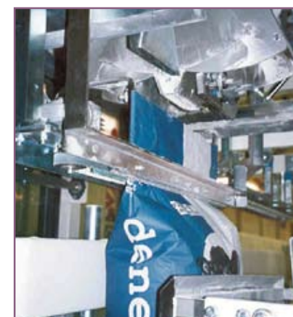
CSA 75 Sistema motorizado de arrastre del saco Sack guiding system through motorised belts