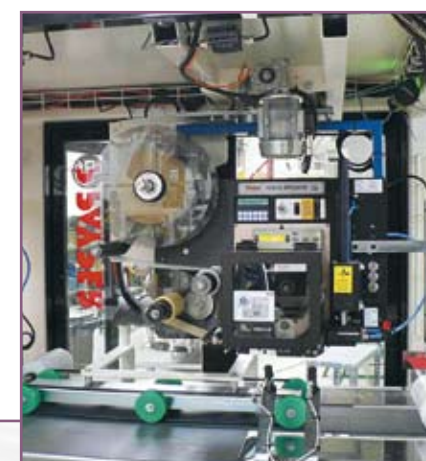
CSA 105 Estación de etiquetado Bag labelling station