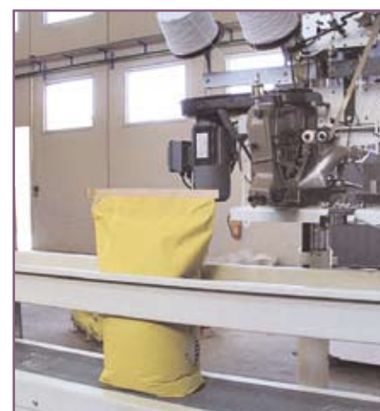
CSA 95 Acabado final del saco lleno Final looking of filled bag