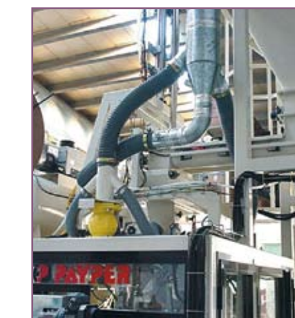
CSA 75 Sistema de aspiración de polvo De-dusting system

COLOCADOR AUTOMÁTICO DE SACOS DE BOCA ABIERTA OPEN MOUTH BAG PLACER