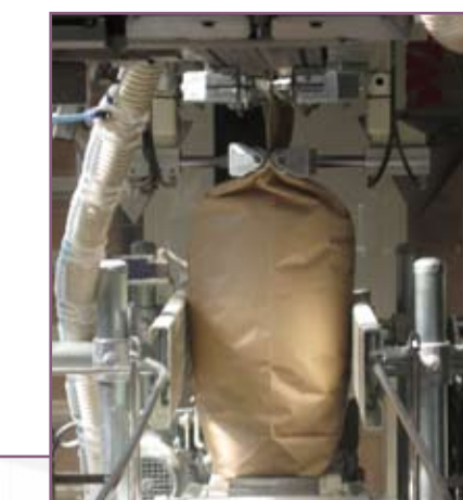
CSA 75 Extracción aire residual Extraction of residual air