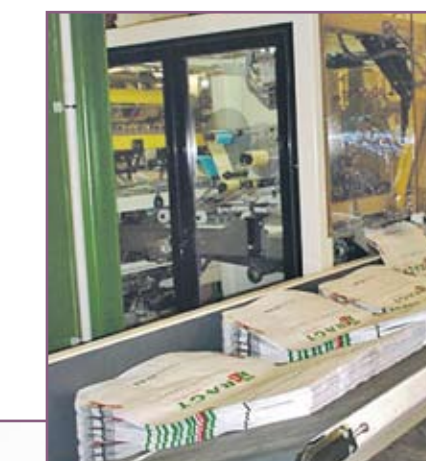
CSA 100 Almacén de sacos vacíos de gran autonomía Large autonomy empty sacks tray