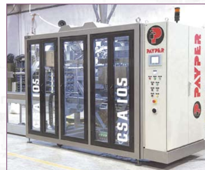
CSA 105 Versión en INOX para productos corrosivos Version in stainless steel for corrosive products