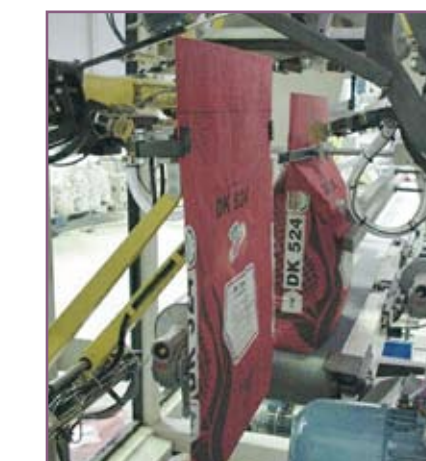
CSA 100 Colocación y estirado del saco Bag placing and stretching