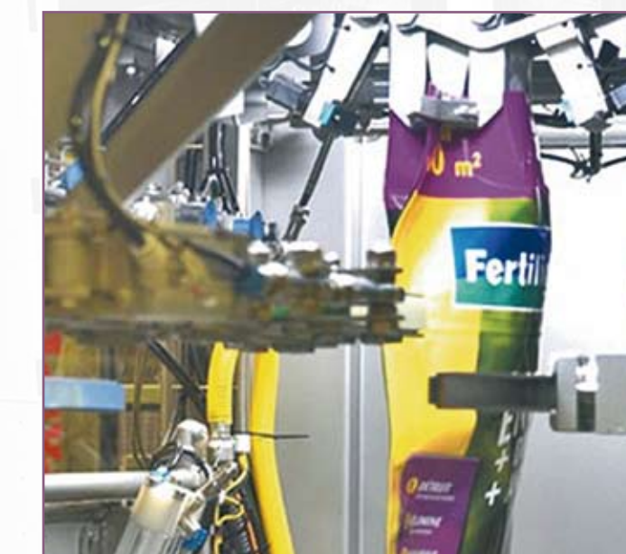
CSA 105 Manipulación de sacos con fuelles laterales Handling of side-gusseted sacks