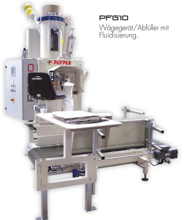
PFG10 Wäegerat/Abfüller mit Fluidisierung.