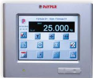
MCB+ Wägesteuergerät mit Tastbildschirm. Hohe Leistungsfähigkeit.