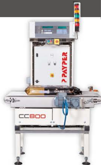
CC800 Gewichtsprüfband mit elektronischem Wägesteuergerät SCB01. Für Stücklasten bis 50 kg.