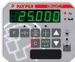
EWC+ Digital Wägesteuergerät. Einfache Nutzung.