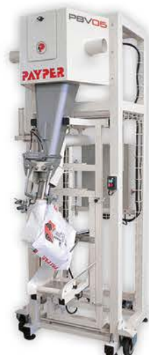
PBV06 Wäegerat/Abfüller nach Nettogewicht, Schwerkraftprinzip.