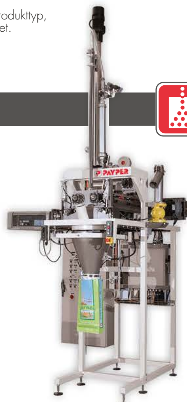
PB15 Besonders geeignet für Produkte mit erschwertem Handling.

Bruttowagen mit verschiedenen Dosiersystemen für unterschiedliche Produkte mit manuellem Absackstutzen oder automatischem Sackaufstecker. Absackleistung bis zu 600 Zyklen/Stunde für 25 kg.