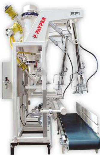
EFI Sackabfüllgerät mit Luftzuführung.