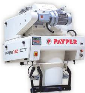
PB12 Einfache Installation, geringe Wartung.

Bruttowagen mit verschiedenen Dosiersystemen für unterschiedliche Produkte mit manuellem Absackstutzen oder automatischem Sackaufstecker. Absackleistung bis zu 600 Zyklen/Stunde für 25 kg.